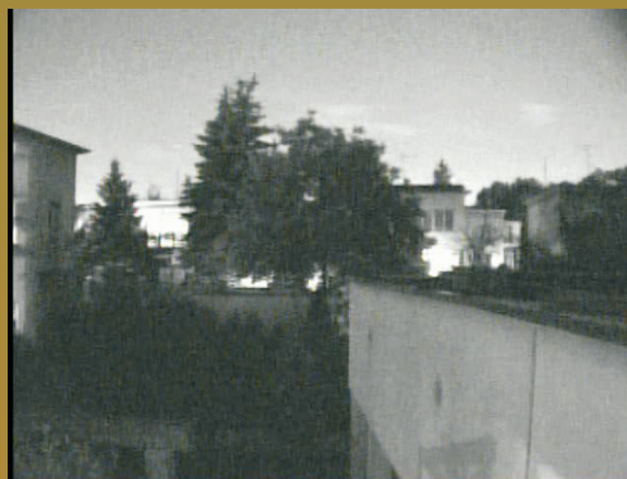
kamera nr 2