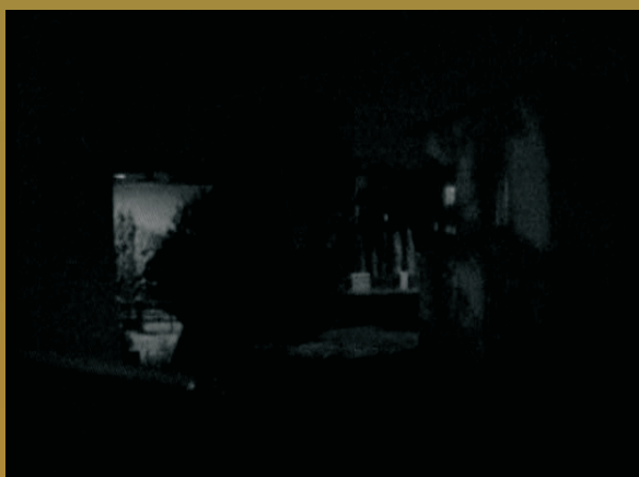
kamera nr 1

Porównanie obrazu z kamer nr 1 bez funkcji DSS, nr 2 z funkcją DSS w tych samych warunkach oświetlenia